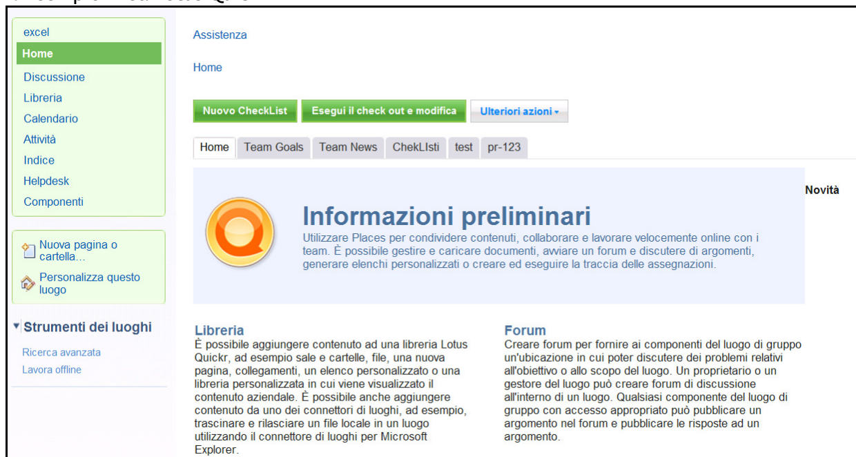
Figura 2: Esempio Area Lotus Quickr